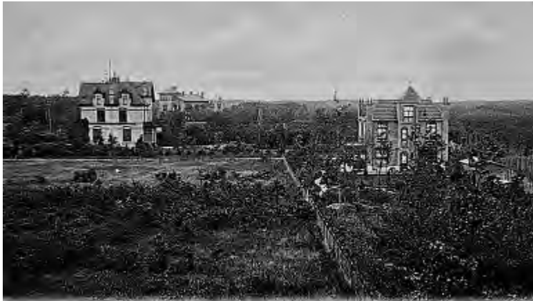
DE BILT, — In de Duinen. 4908