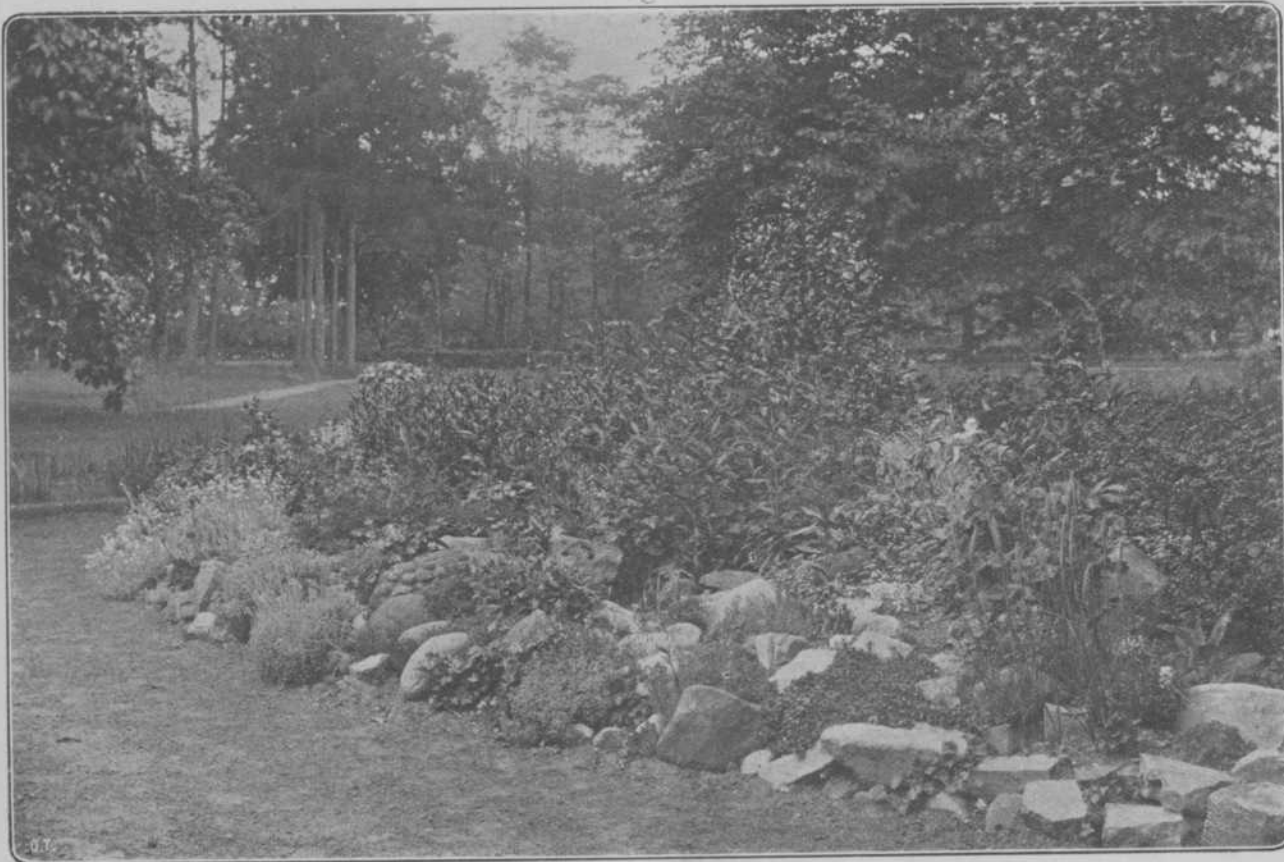
Rotspartijtje op „Beukenburg”.

De auto der familie bracht ons naar het station Hilversum. In reuzenvaart zoog de machine zich tusschen rijen van witte berkenstammetjes door, waarvan het loof tot een doorzichtig gordijn van zacht, fijn groen samenvloede en waarin nu en dan plotseling helgele plekken oplichtten van de in vollen bloei prijkkende brem. Alles suizelden we voorbij en we ston-