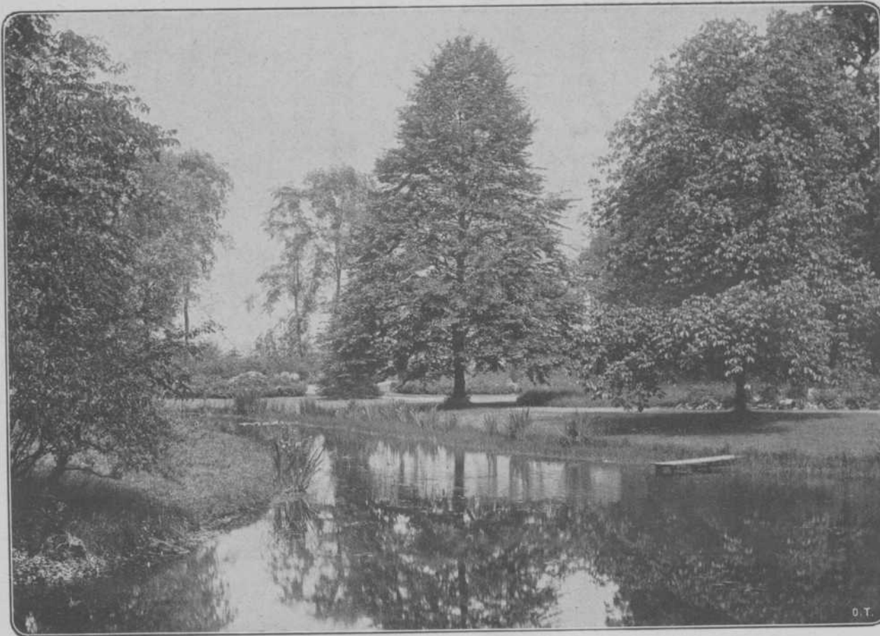
Vijvergezicht op „Beukenburg”.

Maar het is niet alles gesloten bosch op „Beukenburg”. Er is ook een groote weide, beplant met zware boomgroepen, welke prachtige doorzichten te zien geven, een landschap vormend van zeldzame bekooring, vol heerlijke perspectieven. Links en rechts verheffen zich massale groepen van beuken, eiken en wilde kastanjes, welke laatste bij ons bezoek in vollen