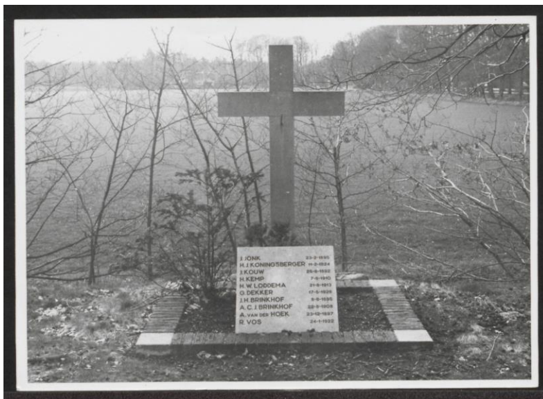
Foto website Zeist oorlogsmonumenten 1

Je komt hier in onze mooie gemeente wonen en gaat samen met je vrouw met de fiets op verkenning. Op een dag ging het richting Soestdijk en we zagen op de grens van Bilthoven en Den Dolder op een onverharde weg naast het bungalowpark “Prinsenburg”, Soestdijkerweg 8a, een oorlogsmonument. Op ca. 25 meter van de weg stond een kruis. Het bleek één van de ruim 3800 in Nederland geregistreerde oorlogsmonumenten te zijn. Er zijn overigens nog vele honderden niet-geregistreerde gedenktekens. Op een granieten plaat bij dit kruis worden 10 namen vermeld.