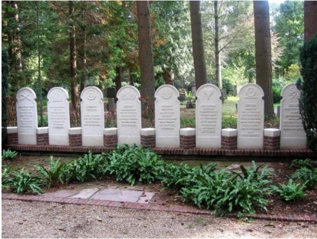
(foto Nieuwe Algemene Begraafplaats Woudenbergseweg te Zeist, D 32 A)

De twee broers Brinkhof zijn begraven op 11 april 1945 op het kerkhof van de Sint Michaëlkerk aan de Kerklaan te De Bilt. In deze kerk zijn zij vele jaren eerder gedoopt. Op 31 mei 1979 zijn zij herbegraven op het Nationaal Ereveld te Loenen op de Veluwe.