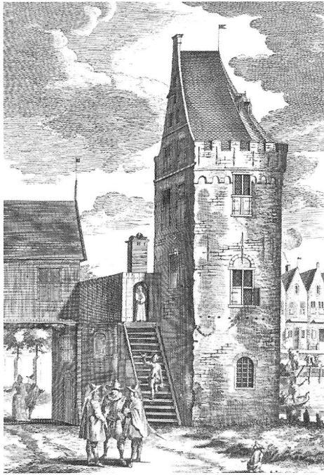
De toren "Zwijgt Utrecht" of "Zwijgt Utrecht" (prent in Jan Wagenaar, II)

Wat het voorgaande nu weer met Amsterdam – zie de titel van dit artikel – te maken had? Niet voor niets heette één van Amsterdams belangrijkste poorten in de veertiende en vijftiende eeuw: "Zwijg (of zwigt) Utrecht".