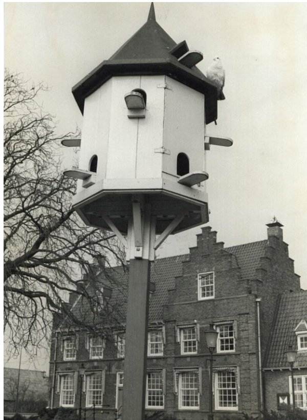
De duiventil bij het gemeentehuis: erfgoed. Foto uit 1977 (SAGV 236-D1 6114).