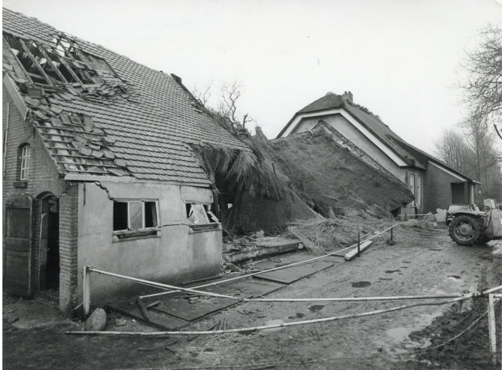
Ravage na windhoos begin januari 1981, de getroffen boerderij van Van Voorst op de Prinsenlaan (SAGV 236-D1 6189).