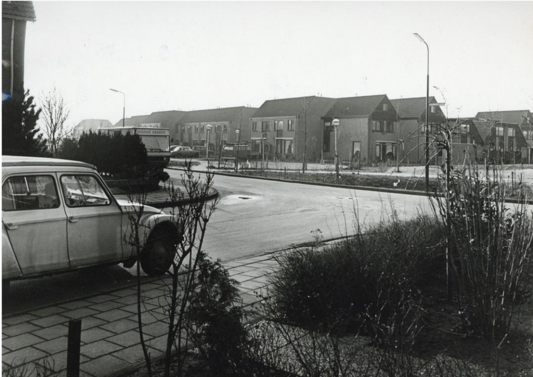
Foto van 18 januari 1978. Zicht op de twee jaar eerder gereedgekomen Bereklaauw vanaf de Sperwerlaan (SAGV 236-D1 6168).