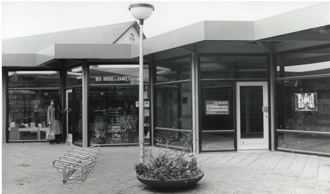
De Marijkehof in 1977 (SAGV 236-D1 6192).