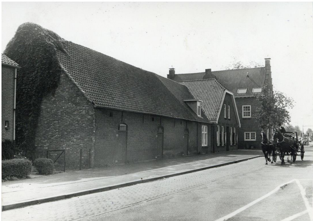
Foto van september 1977, de situatie voor de bouw van het nieuwe deel van het gemeentehuis (SAGV 236-D1 6117.)