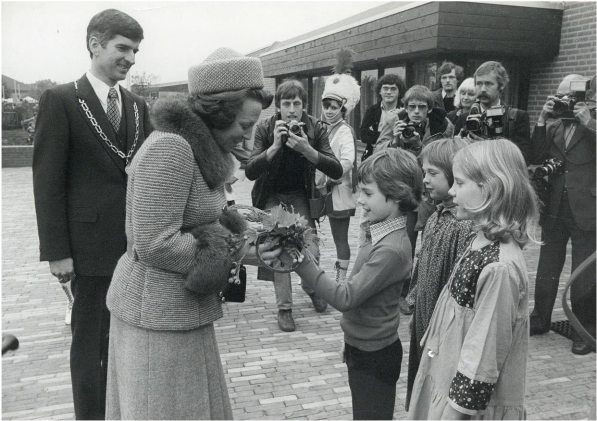
Foto van 28 oktober 1978. Opening van de Vierstee door prinses Beatrix, in gezelschap van burgemeester Panis (SAGV-D1 6177).