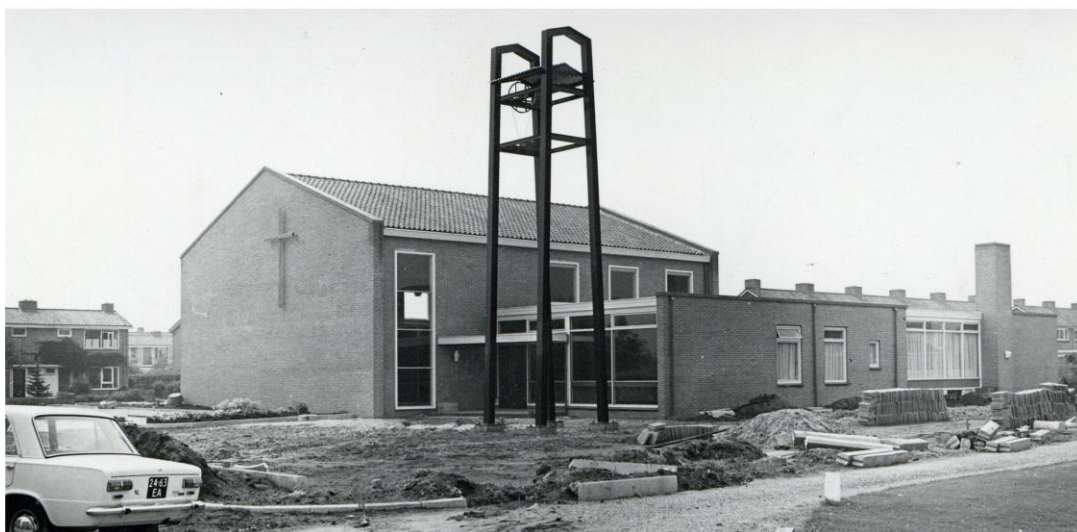
De Ontmoetingskerk in aanbouw, juni 1967 (SAGV 236-D1 6124).