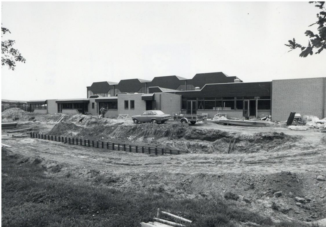
Foto van september 1978. De bouw van de Vierstee in beeld (SAGV 236- D1 6175).