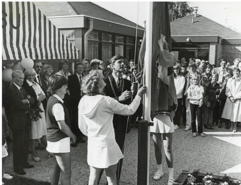
Op 31 mei 1980 werd het nieuwe clubgebouw – dat inmiddels plaats maakte voor woningbouw – van T.V. Toutenburg door burgemeester Panis geopend (SAGV-D1 6170).