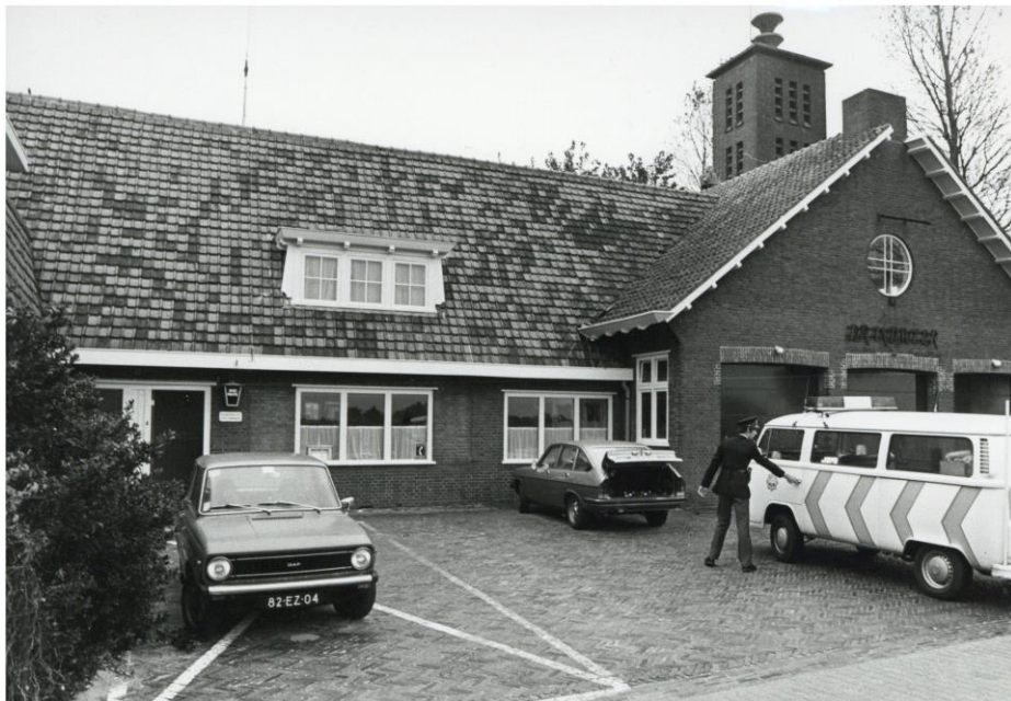
Het voormalige Maartensdijkse politiebureau, 27 september 1979 (SAGV 236-D1 6141).