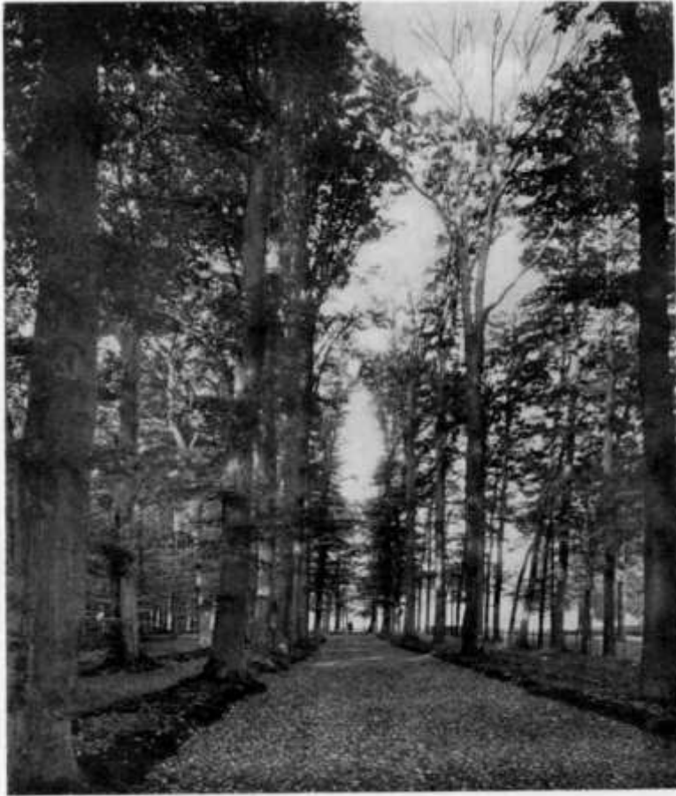
LAANTJE BIJ HUIZE „VOLLENHOVE”