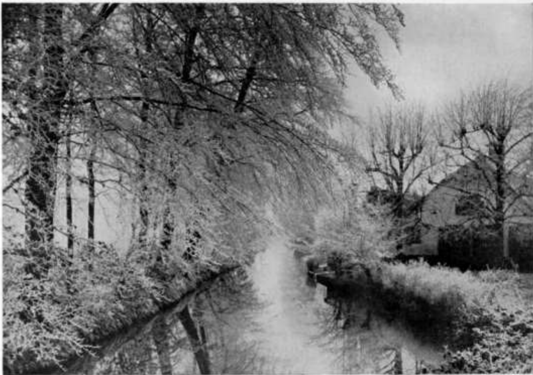
BILTSCHER GRIFT ACHTER „VOLLENHOVE”