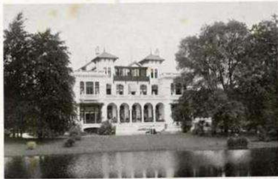
„Ma RETRAITE“ BIJ ZEIST