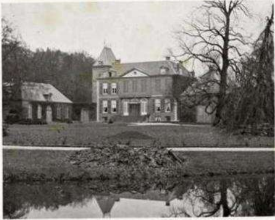
„HOUDERINSEN“ BIJ DE BLOET