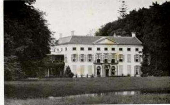
„VOLLENHOVEN“ BIJ DE BLOET