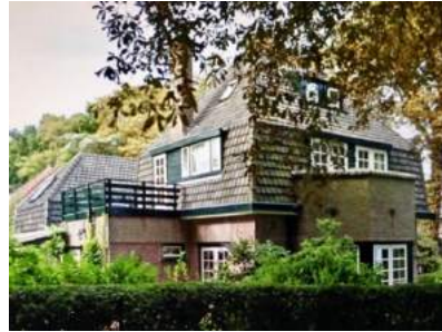
Voormalige Villa "Bregitta" in 2017