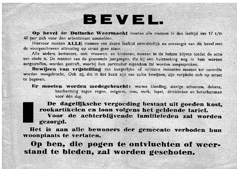
Pamflet uit familiearchief

Verdedigingswerken moeten worden gegraven. Vanaf half november worden - stad voor stad - mannen in de leeftijd van zeventien tot en met veertig jaar opgeroepen zich te melden voor de 'arbeidsinzet', zoals dat eufemistisch wordt genoemd.