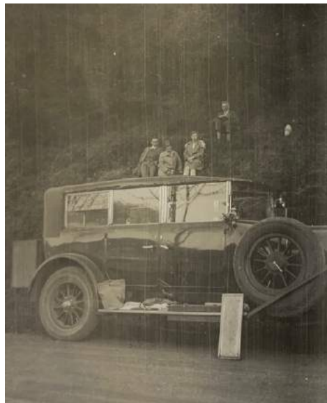
Ahrhütte, Blankenberg, Duitsland, mei 1928