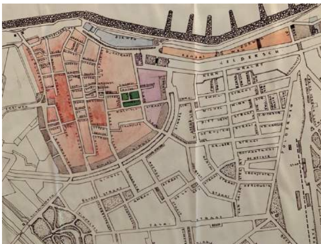
Plattegrond Den Helder in WO II,

Tot onze verrassing krijgen mijn broer en ik een verlengde kerstvakantie aangeboden. Die mag wat ons betreft eeuwig duren. Buiten is het koud. De temperatuur komt in de maand januari slechts af en toe boven het nulpunt. We wonen op de hoek van de van Speijkstraat en de Wilhelminastraat. 74 Als we deze laatstgenoemde straat uitlopen belanden we in Oud Den Helder, dat lijkt gebouwd te zijn rond de Rijkswerf.