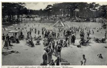
De Biltsche Duinen rond 1938