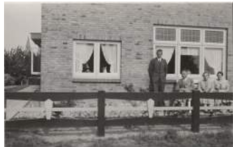
Nieuweweg 3, Heerhugowaard, augustus 1936