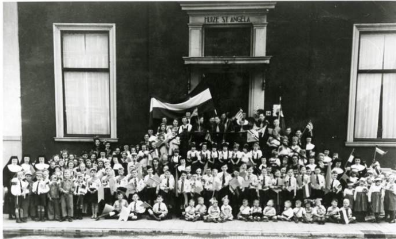
Huize St. Angela, 6 mei 1945.