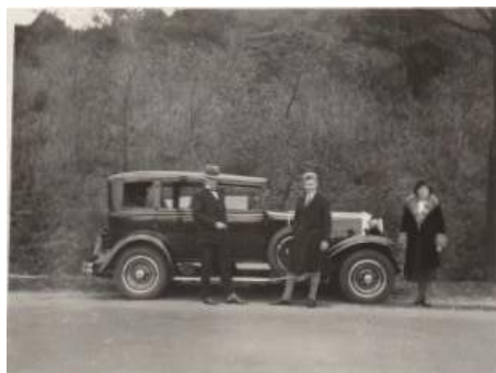
Met de 'Graham' naar Rolduc, 20 april 1931