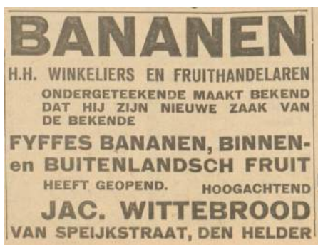
Heldersche courant, 01/06/1929

de stijl van de Amsterdamse School. Hij laat het realiseren in de eerste helft van 1929. Op de begane grond komen acht cellen voor het rijpen van bananen. Er onder, in de kelders, is opslagruimte om fruit koel te bewaren. Op zolder liggen voorraden, die minder temperatuurgevoelig zijn. Aan weerszijde op de eerste etage bevinden zich twee wooneenheden. De huisnummers 3 en 7. De bananenrijperij staat genoteerd als nummer 5. Het gehele complex bevindt zich op de hoek van de van Speijkstraat en de Wilhelminastraat en is de status van een gemeentelijk monument waardig.