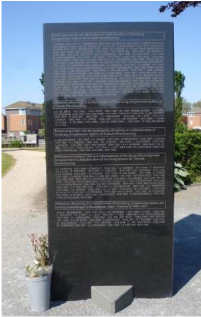
Monument voor Vrijheid en Vrede, eerste groep betreft verzetslieden