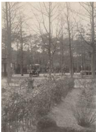
Bilthoven, maart 1926