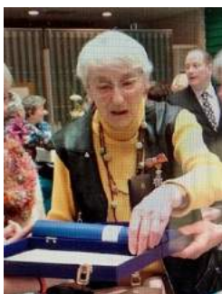
2016, onderscheiding 26