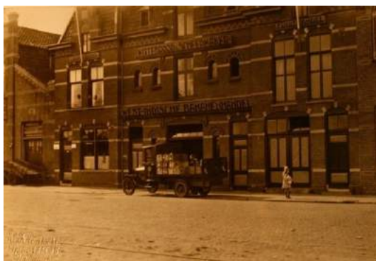
Firma Wittebrood & Scheepmaker, Handelskade 14 – 16, 1926

Het duurt niet lang of het bedrijf is alweer te klein. Op de Handelskade wordt een nieuwe locatie gevonden, waar maar liefst zeven stookhokken geplaatst kunnen worden. De bananen onder de merknaam 'Fyffes' vliegen de deur uit.