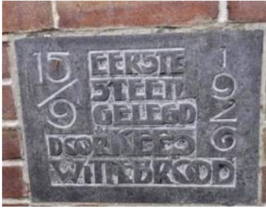
Eerste steen, 15 September 1926