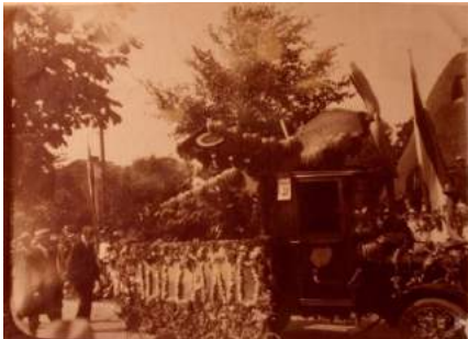
Bloemencorso, Bergen, 1927

Wellicht is het bij een avondwandeling langs het strand van Bergen aan Zee geweest, dat Jacob de brainwave kreeg om met een praalwagen deel te nemen aan het Bloemencorso van Bergen. Jacob is onder de indruk van de prestatie van Charles Lindbergh, die in mei 1927 solo en non-stop de Atlantische oceaan overvliegt.