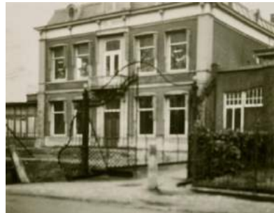
Lommerrijk' in de eerste oorlogsjaren met links de boom en in 1945 'Lommerrijk' zonder boom

Het hout is bestemd voor de kachel in de voorkamer. De enige kamer waarin wordt gestookt. Op zaterdagavonden zitten we rond die haard en kijken hoe de 'broeder' langzaam in de pan rijst. Met stroop, een van de zeldzame lekkernijen. Soms bij kaarslicht als de elektriciteit weer eens is uitgevallen. Toch hebben we het niet slecht. Ik kijk in het kasboek en zie dat mijn moeder een streep door de post van uitgaven voor 'banket' heeft gezet. Er wordt niet meer gesnoept en ook geen bezoek meer ontvangen. Alle ooms en tantes, die ons huis regelmatig bezoeken, blijven thuis. De petit fours bestaan alleen nog maar in de verbeeldingswereld. De uitgaven aan het huishouden beperken zich steeds meer tot het hoog noodzakelijke. We zijn zuinig met zeep dat zeer schaars is. We leren de restanten van het zeepblokje op het nieuwe stukje te plakken. Een gewoonte die ik mijn leven lang zal hanteren.