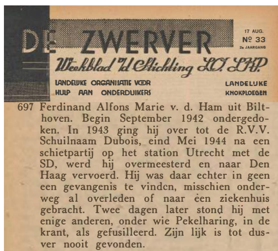
De Zwerver, 17/08/1946