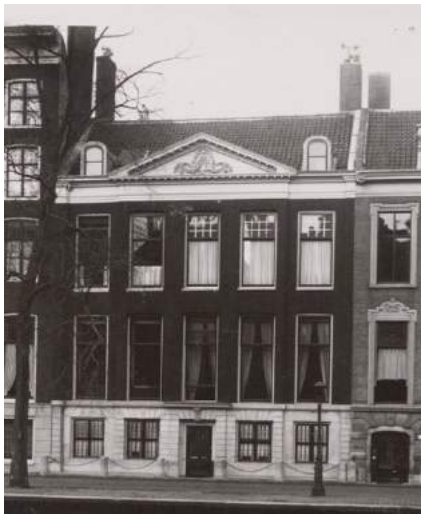
Heerengracht 571, Amsterdam, 1943