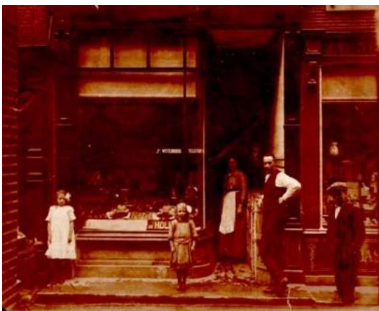
De Blauwe Druif, 1920

Catho kent een druk leven. Naast de zorg voor haar kinderen helpt zij ook regelmatig in de winkel. Op de foto staat zij verscholen in de deuropening. Henny en Cokky hebben zich met een grote bloem in het haar op de stoep opgesteld.