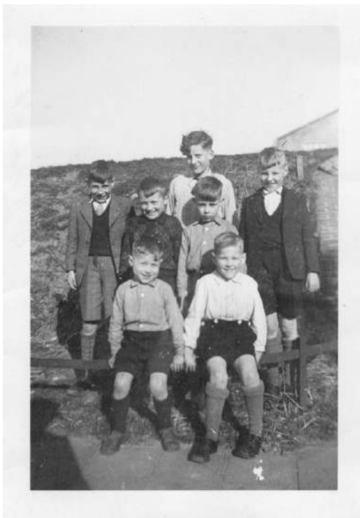
De Bende van Zeven, april 1945

Onze vrienden uit de buurt zien wij dagelijks. Ook zij gaan niet meer naar school. De scholen in Den Helder zijn gesloten. Sommige ouders vinden nog wel een uitweg in een school in Julianadorp, maar wij genieten onbekommerd van onze 'gedwongen' vrijheid.