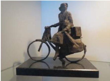
Beeldje van koerierster 53

onderduikers of verzetsmensen, staat op de uitkijk, spioneert of brengt de uitgaven van illegale bladen rond. Een indrukwekkende lijst van activiteiten.