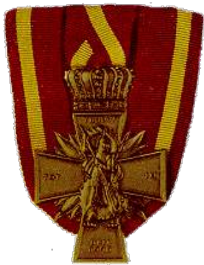
Verzetskruis 1940 – 1945