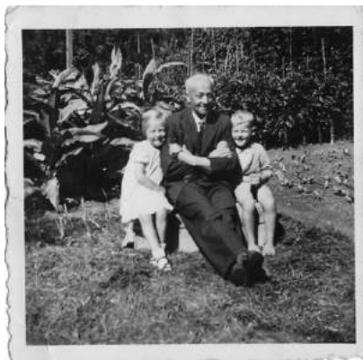
Venhuizen, zomer 1944

Maandagmorgen 4 september gaat mijn vader met de fiets naar kantoor en vertrekt in de loop van de ochtend, lopend van kantoor naar het station, om per trein naar een middagvergadering in Alkmaar te gaan. Fietsen kun je maar beter veilig in de stalling van het kantoor laten staan, in plaats van ergens bij het station.