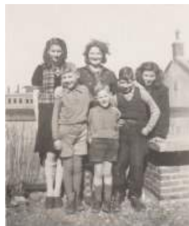
'oorlogsetertjes', april 1944

Op de achterzijde van de linker foto heeft tante Co geschreven 'pleegvader met zijn pleegjongens' en op de onderstaande foto 'Moeder Co met haar vijf oorlogsetertjes'.