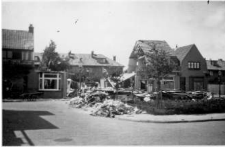
Van Speijkstraat, Den Helder, 1940