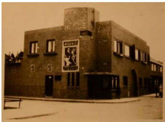
Bananenrijperij, van Speijkstraat 5, Den Helder, 1929