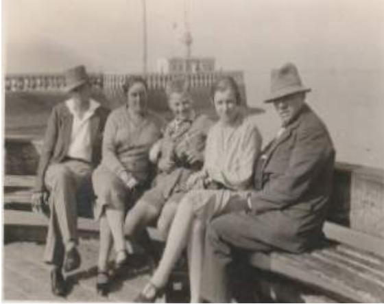
Boulogne sur Mer, 9 september 1929

Er blijft dus ruim tijd over om de omgeving te verkennen, een boottocht naar Engeland te maken en wat langs de boulevards te flaneren. Het weer helpt gelukkig ook een handje mee. Vrijdag plaatst de garagehouder een nieuwe as. De vertraging heeft al met al een week geduurd.