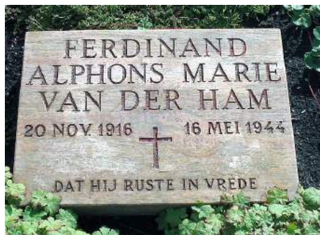
Eeregrafhof, grafsteen Ferdi van der Ham, grafkuil VII, vak 6.

Na de plechtigheid in de kerk, waar inmiddels een ware bloemenzee is ontstaan, volgt het gezelschap van genodigden door een erehaag van honderden padvinders de baar van Hannie Schaft in een lange stille tocht naar de Eeregrafhof via Haarlem en Bloemendaal over de Zeeweg naar de begraafplaats in de duinen van Overveen.