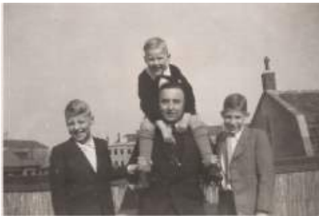
'Pleegjongens', april 1944

Met de aantocht van de Canadezen in zicht maken tante Co en oom Cas een tweetal foto's op het terras van hun woning. Het worden afscheidsfoto's.