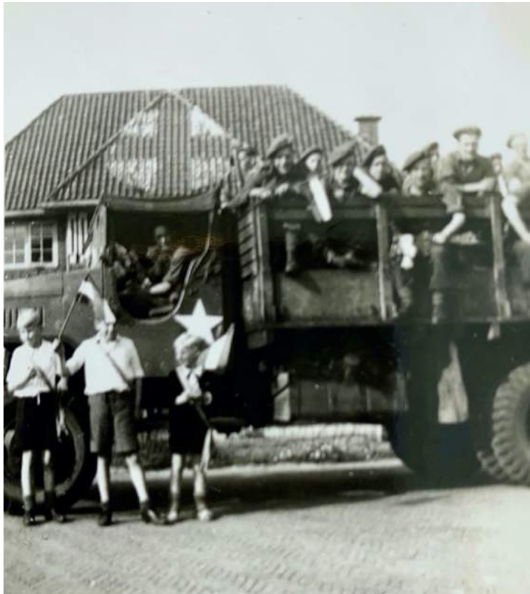
Den Helder, 8 mei 1945

De Canadezen trekken op 8 mei 1945 Den Helder binnen. Eens een welvarende stad, strategisch gelegen in de kop van Noord-Holland. In de Tweede Wereldoorlog is het de meest gebombardeerde stad van Nederland. De sterk uitgedunde bevolking heet hen uitbundig welkom. Wij staan langs de kant en zwaaien naar onze bevrijders. Ik ben de kleinste. Vijf jaar oud, rood wit blauw vlaggetje in de hand en een grote oranje sjerp om de borst. Waar komt die uitdossing ineens vandaan? Het lag al maanden klaar, wachtend op de grote dag. Het pakje van zwart fluweel verbergt onzichtbaar achter de revers een speld die deze dag even zijn functie verloren heeft. In mijn geheugen heeft dit prikapparaat een vaste en onvergetelijke plaats gekregen. Mijn kniekousen zijn afgezaakt. De rek is uit het elastische bandje, dat boven de kuit om het been hoort te spannen. Ik weet het op die meidag in de laatste oorlogsmaand zelf nog niet, maar ik zal de schrijver worden van een levensverhaal.