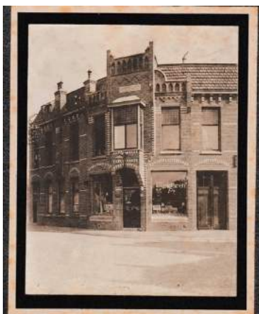
Willemstraat 1/ hoek Laan van Middenburg, Voorburg

Als het huis met achtertuin en vrije opgang een half jaar later in de openbare verkoop wordt gedaan, wordt het uitgebreid beschreven.