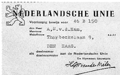
Voorlopig lidmaatschap Ned. Unie, 1940

Er dient zich na de eerste maanden van oorlogsverwarring een prangende vraag aan. Wat moet de houding van de Nederlandse burgers zijn ten opzichte van de vijand? Uiteraard verschillen daarover de meningen. Plegen we verzet of proberen we een soort overlegstructuur of samenwerking te creëren?