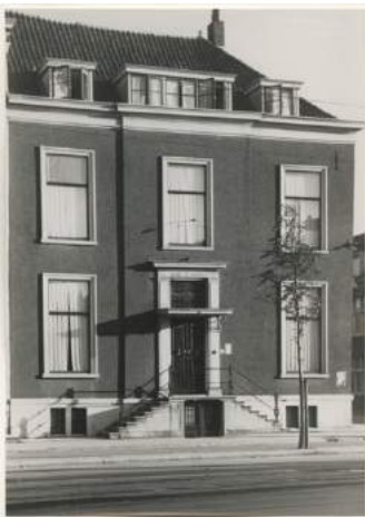
Huize St. Angela, Prinsegracht 14, 1943