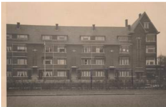
Begin van de Thorbeckelaan, 1938