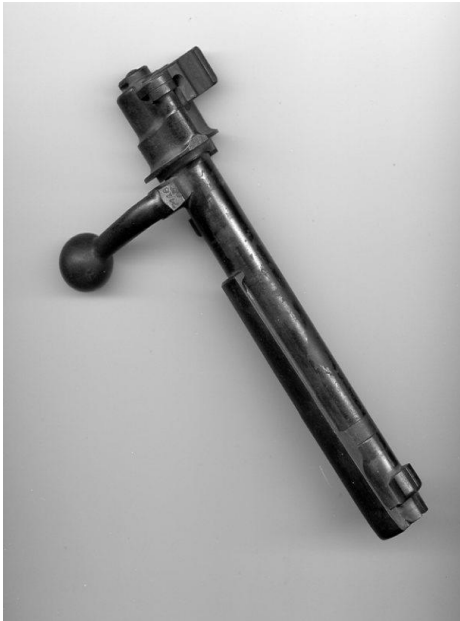
De grendel, als aandenken bewaard.