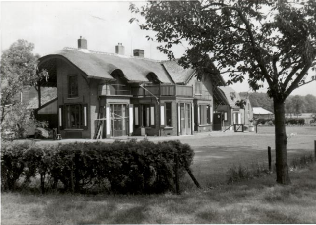
De Hoeve – De Bilt