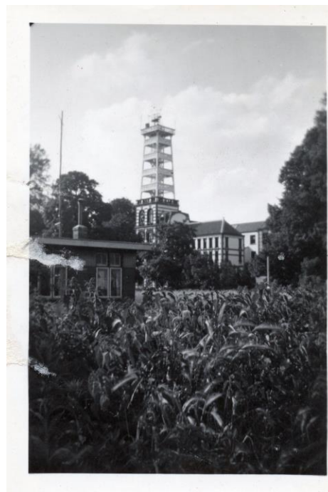
De karakteristieke KNMI toren tijdens de oorlog