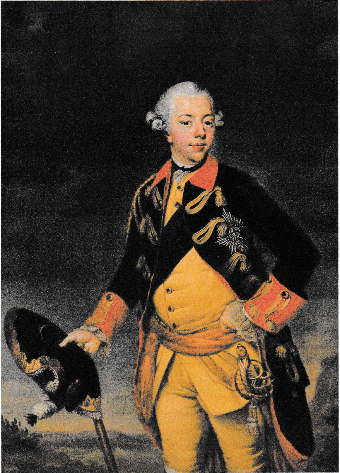
Stadhouder Willem V. Johann Georg Zisenis, Mauritshuis.

Da des Königs von Preußen Majestät, ungeachtet wiederholentlicher Anfragen, keine Satisfaction über die Ihnen angethane Beleidigung, wegen der Gefangennehmung Sr. Majestät