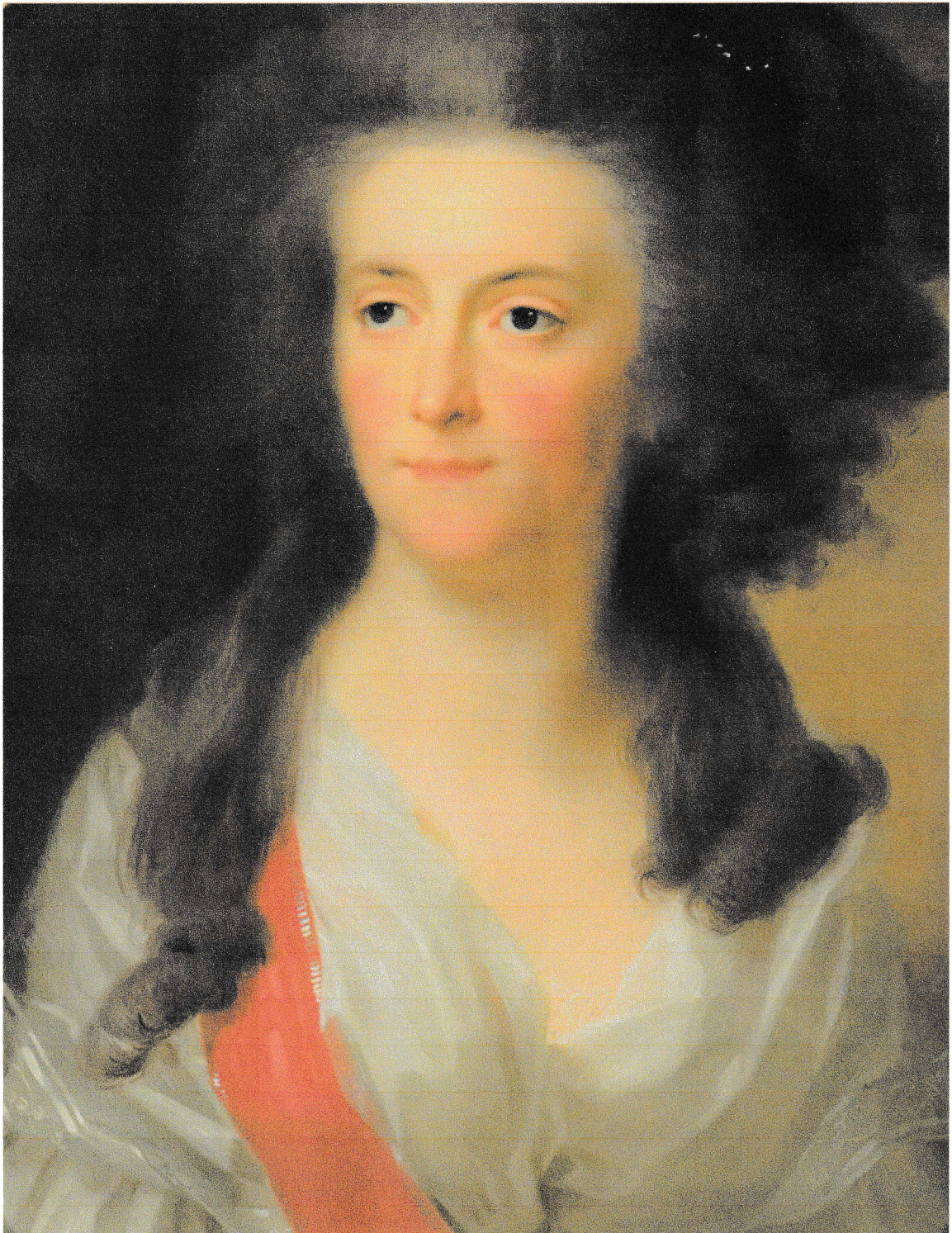
Wilhelmina van Pruisen, echtgenote van Willem V.