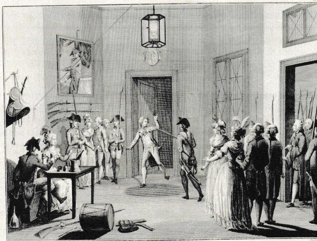
Arresto della Real Principessa Sofia sposa di | Saisie de la Royale Princesse Sophie femme Guillaume V. de Nassau Dietz, e sorella di Fe | de Guillaume V. de Nassau Dietz, et soeur de derico Guisclimo Re di Prussia. | Frederic Guillaume Roi de la Prusse

Frederik Willem liet op 3 juli 20.000 man aan troepen samentrekken in het Pruisische hertogdom Kleef, dat direct aan de Republiek grensde. (De Republiek had tot 1672 een garnizoen in Kleef, maar in 1701 werd de stad Pruisisch bezit.) De Pruisen bevonden zich dus praktisch al in de Republiek. Willem V op zijn beurt had in de Republiek 6.000 man aan troepen tot zijn beschikking, zodat er totaal 26.000 man beschikbaar waren voor militair ingrijpen tegen de patriotten.