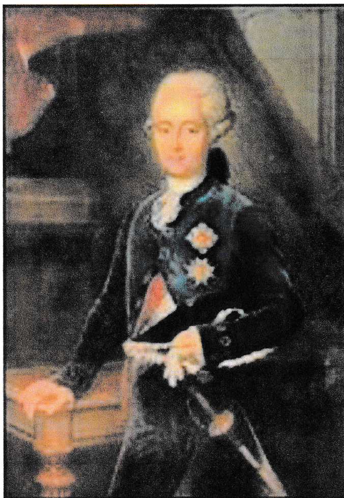
De Rijngraaf