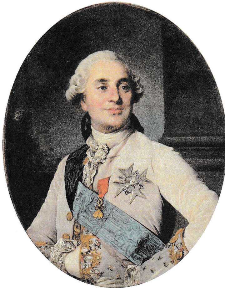
Joseph-Siffred Duplessis. Lodewijk XVI, paleis Versailles.

[Zijne Majesteit, de koning van Pruisen, kreeg, ondanks herhaalde verzoeken, geen voldoening voor de belediging van de kant van de Staten van Holland, te weten de arrestatie van Zijner Majesteits zuster, de prinses van Oranje, op haar reis naar Den Haag haar aangedaan. Daarom heeft dezelve Allerhoogste Majesteit [Frederik Willem] besloten om met een korps troepen van 25 bataljons en 25 eskadrons op te trekken en zelf de eerherstel het gewest Holland te gaan halen.]