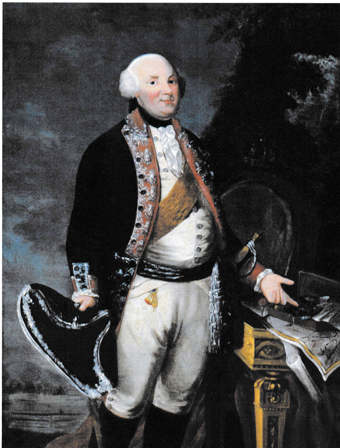
W. Faber, Friedrich Wilhelm II, 1789. „Inventar Burg Altena“.

Overijssel, (gebieden waar de patriotten de overhand hadden) werden in staat van verdediging gebracht. In Utrecht stonden de patriotse troepen onder leiding van de een politieke avonturier, de Rijngraaf Frederik III van Salm-Kyrbourg.