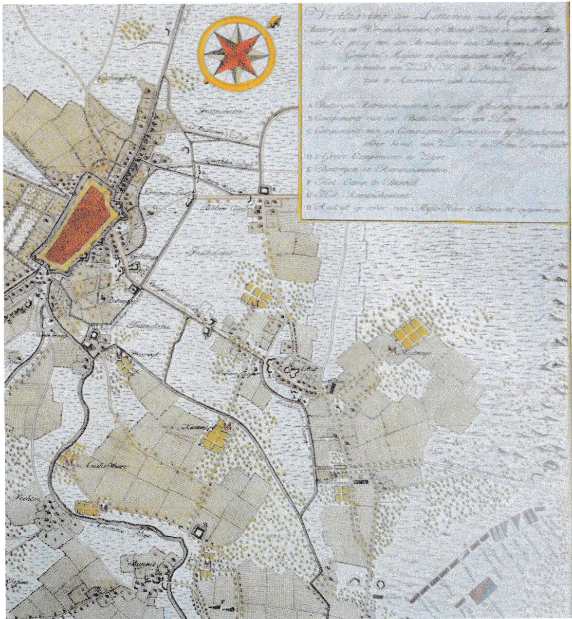
Situatietekening van de militaire situatie bij De Bilt in 1787 t.t.v. de Pruisische inval. Detail van een kaart uit 1787, Nationaal Archief 4 VTHR, inventaris 4644